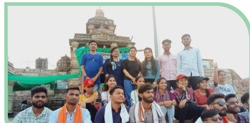
B.Pharm Second Year Tour at Ramtek.