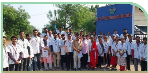
B.Pharm Final Year Industry Visit at LR Pharmaceuticals, Parbhani.