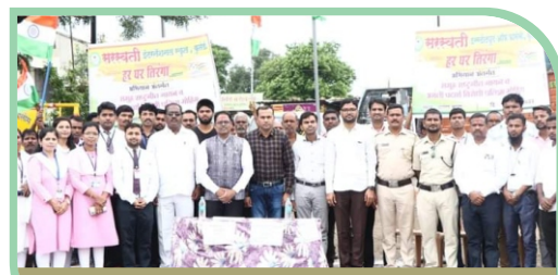
Oath Against Consumption of Narcotics Substances on Occasion of Har Ghar Tiranga.