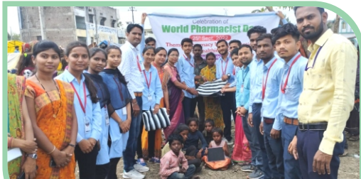
Distribution of Food Grains to Destitute Families at Ardhapur