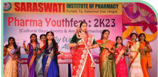
Pharma Youthfest - 2K23 : Cultural Day