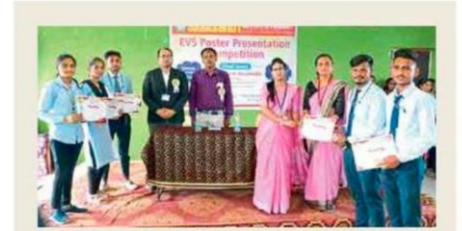
वारंगा फाटा : कुर्तडी येथे भितीपत्रक स्पर्धा कार्यक्रमास उपस्थित मान्यवर.