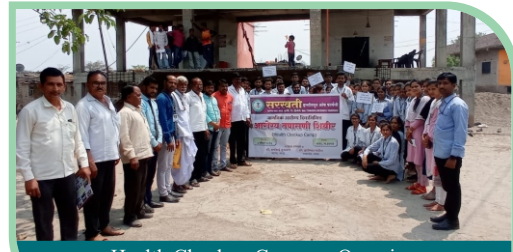
Health Checkup Camp on Occasion of World Health Day.