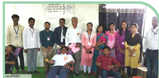
Blood Donation Camp on Occasion of World Pharmacist Day.