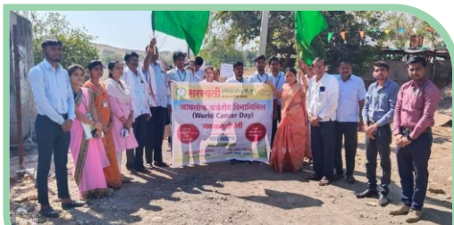
Cancer Day Awareness Rally at Rameshwar Tanda