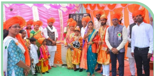
Celebration of Shiv Jayanti