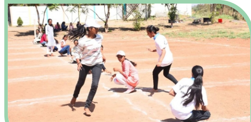
Celebration of Annual Sports Week